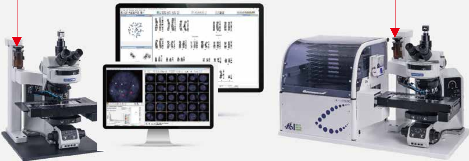
自动滴油器 (Automatic Oil Dispenser)